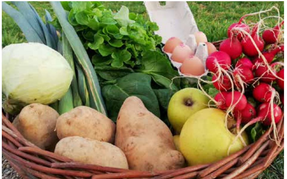
↑ Pour les femmes enceintes et sans condition de ressources un panier de légumes frais des Gorges de l'Aveyron est offert chaque semaine.

• Pour les loisirs : le CCAS met en place une tarification sociale à la piscine municipale, basée sur le quotient familial.