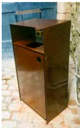
← Un prototype des nouvelles poubelles a été testé avec succès place de la Halle.

Dans le village, finis les poubelles uniques. Un prototype de poubelle réalisé par des artisans locaux a été testé avec succès place de la Halle pour vérifier sa praticité pour les habitants comme pour les agents. Il va être généralisé dans les semaines